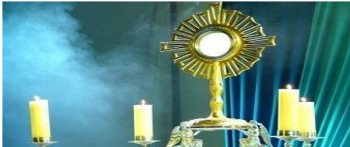
Reposição do Santíssimo Sacramento no Sacrário

- À vossa proteção nos acolhemos, Santa Mãe de Deus, não desprezeis as nossas súplicas em nossas necessidade, mas livrai-nos de todos os perigos, ó Virgem gloriosa e bendita. Amen.